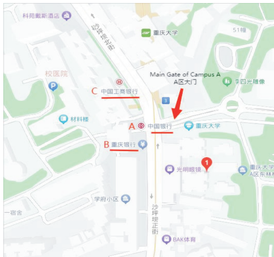
图9 重庆大学A区大门附近的银行

学校建议同学们在入境后, 先在银行兑换外币及开立人民币账户, 并且申请银联卡; 再到学校来刷卡缴纳学费。